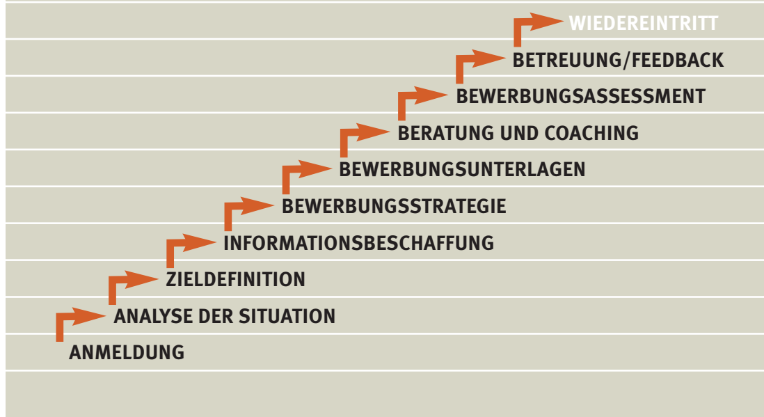
ABB. 1 www.euspug.at