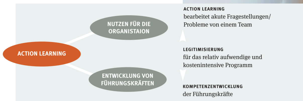
ABB. 1 Action Learning im Trend der Führungs- kräfteentwicklung

Für die Analyse der existierenden Lernkultur entwickelte »scil« somit ein wissenschaftlich fundiertes Instrument, das zur Diagnose in Unternehmen bereits mehrfach zum Einsatz gekommen ist. 6 Dieses Instrument sollte im Anwendungsfall sprachlich an die Unternehmensspezifika angepasst und im Hinblick auf seine Relevanz und Verständlichkeit überprüft werden. Mit ausgewählten Vertretern der Anspruchsgruppen in einem Unternehmen sollte das Modell zudem im Rahmen von Workshops validiert werden. Damit können nicht nur die Lernkultur-Komponenten konsolidiert, sondern auch die Bereitschaft zur Unterstützung der nachfolgenden Untersuchungsschritte erhöht werden.